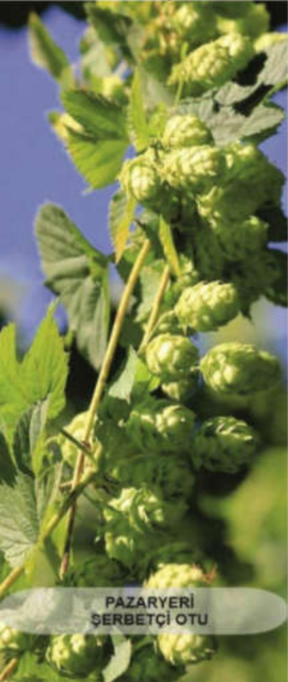
PAZARYERİ SERBETÇİ OTU