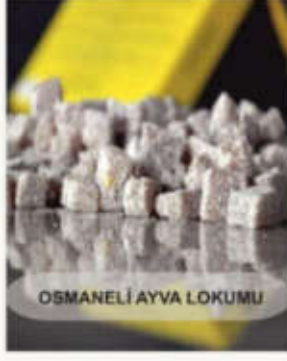
OSMANELİ AYVA LOKUMU