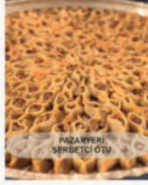
PAZARYERİ SERBETÇİ OTU